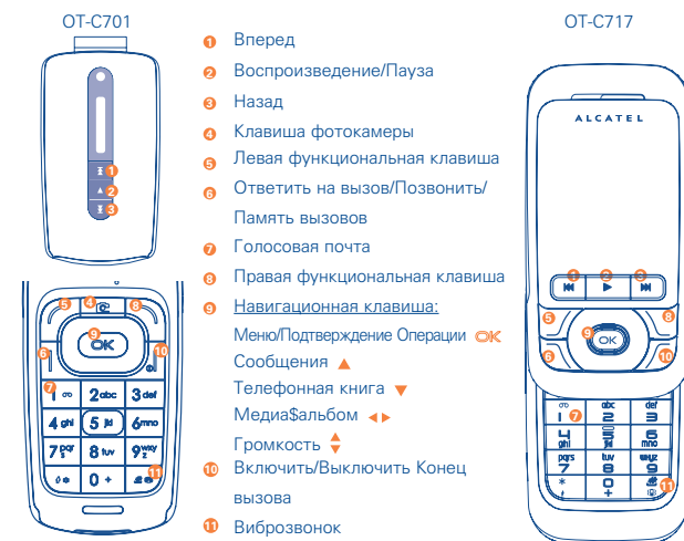
OT-C701 OT-C717 ALCATEL mobile phones