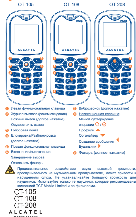
OT-105 OT-108 OT-208 ALCATEL mobile phones